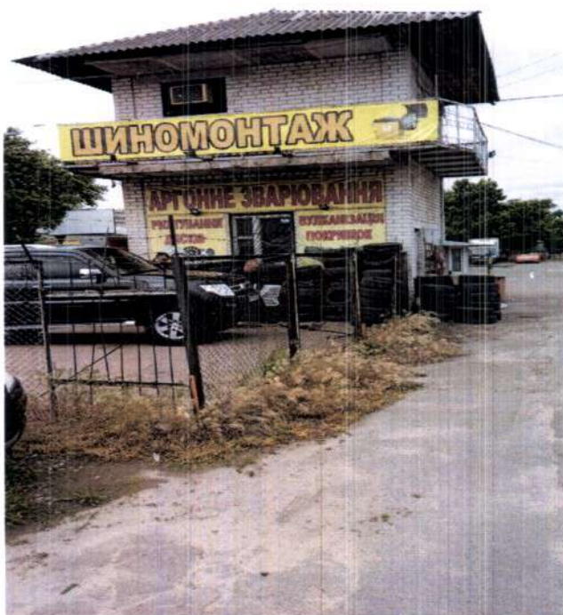
Шинномонтаж на майданчику для паркування по вул. Жмеринська, 2.