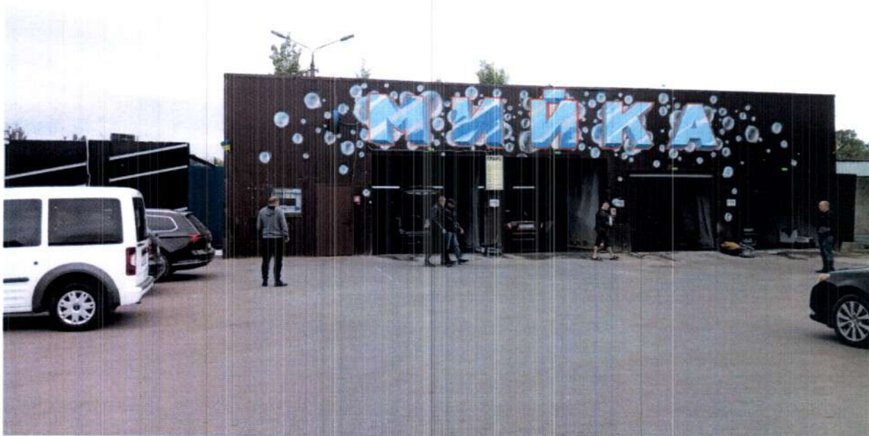
Увізка для автомашин на майданчику для паркування на просп. Палладіна, 23.