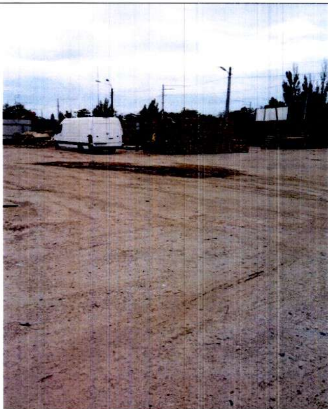
Використання паркувального майданчика для складування матеріалів на майданчику для паркування на просп. Палладіна, 23.

Відмічається, що на 8 майданчиках на 265 машиномісць паркувальний простір відсутній взагалі, в тому числі: