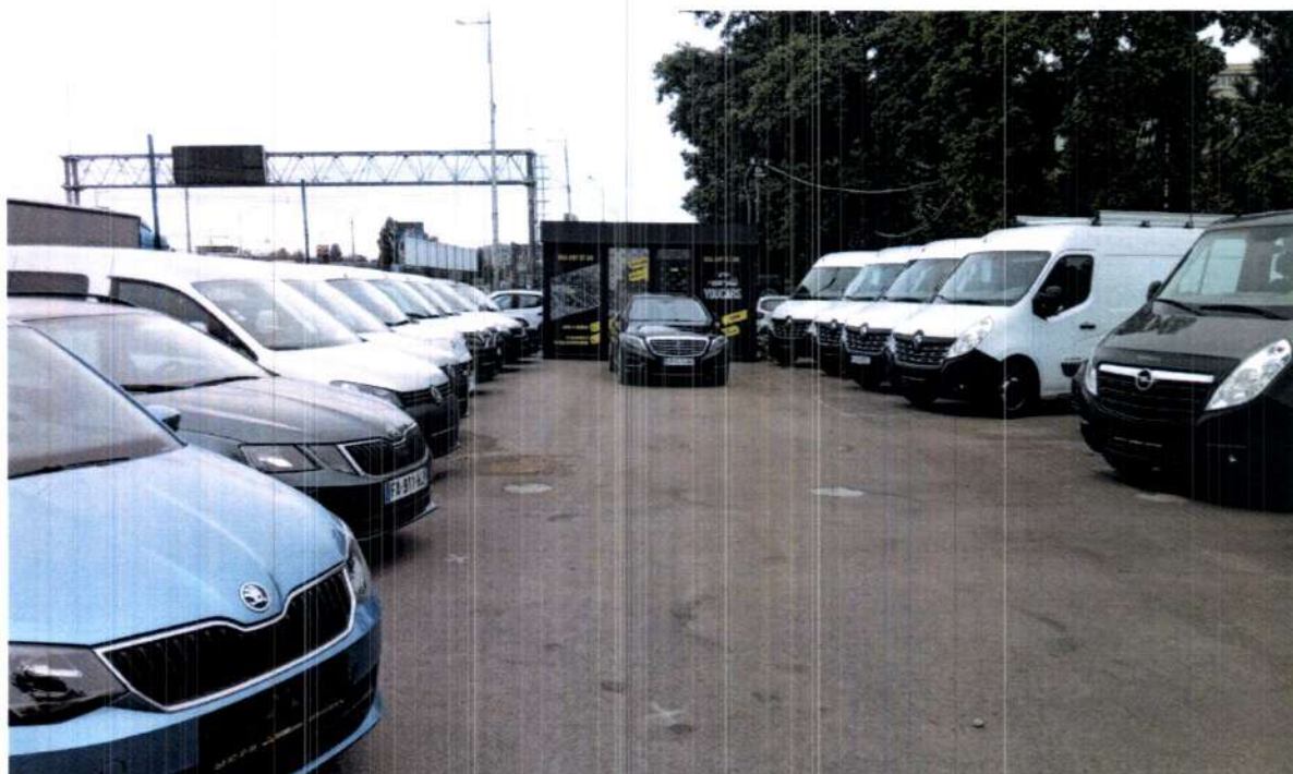
Сайт з продажу автомобілів YOU CARS, вул. Велика кільцева, навпроти буд.52-58/2 по вул. Зодчих, замість паркувального простору на 50 машинмісць.